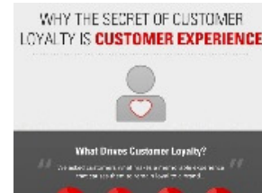
What Drives Customer Loyalty? 1041 views by Eloqua

Informativa del Ministro per la coesione territoriale Carlo Trigilia al Consiglio dei Ministri del 27 Dicembre 2013