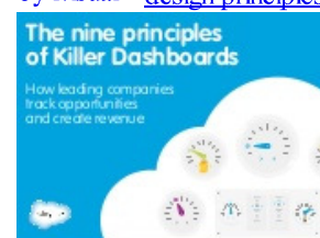
The Nine Principles of Killer Dashboards 5848 views by Salesforce