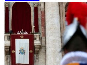
Christmas Day around the World 1285 views by guimera