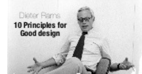
Dieter rams's 10 design principles 4190 views by ivisual